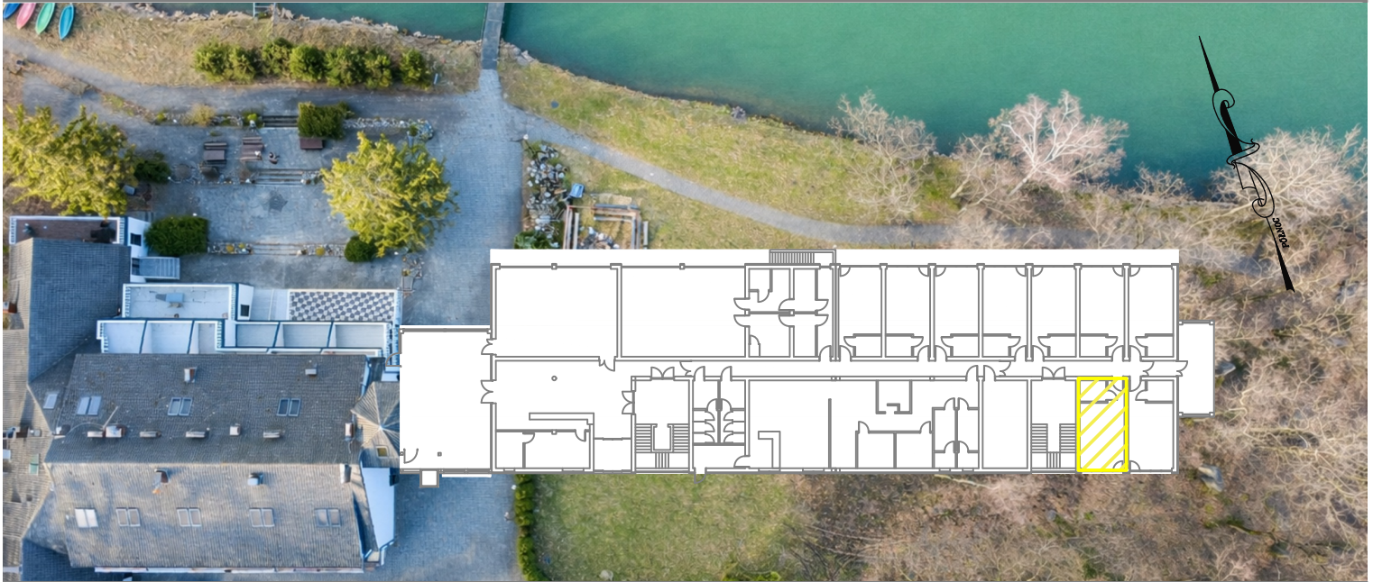
BUDYNEK HOTELU- PARTER