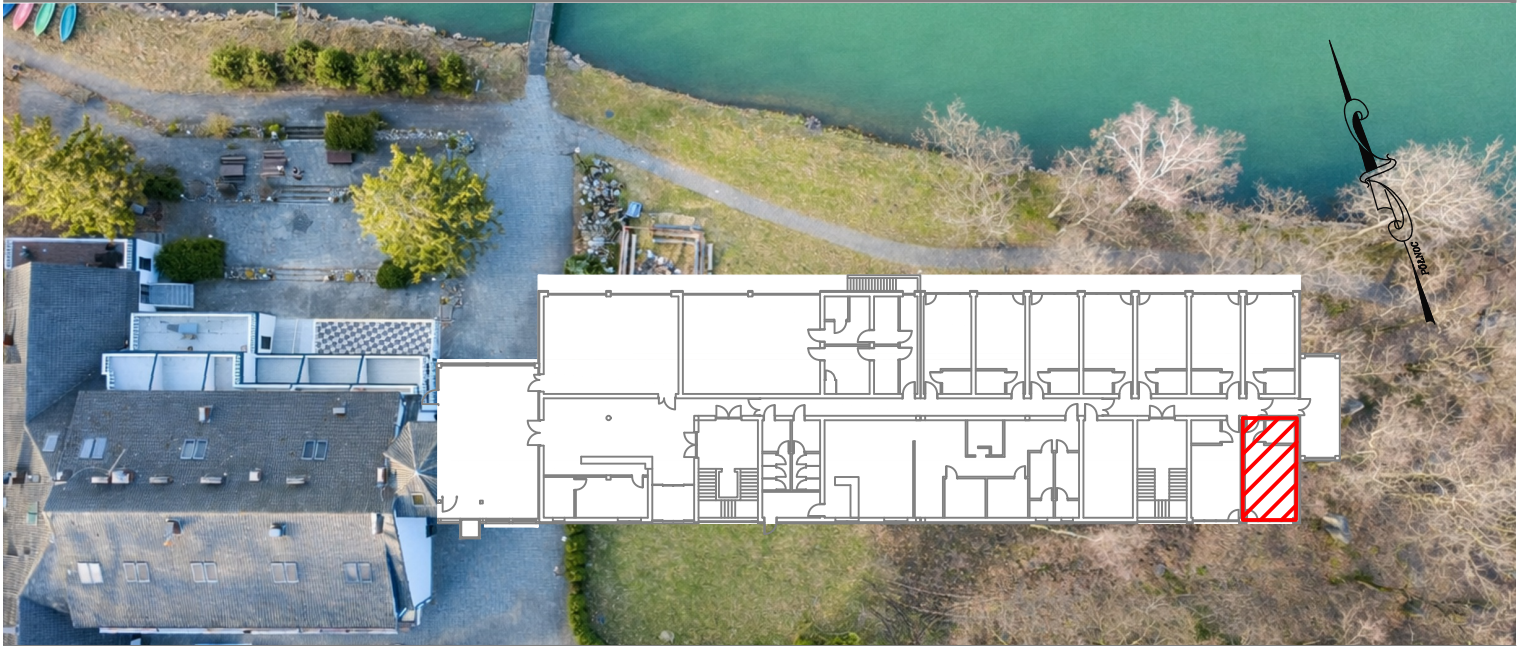
BUDYNEK HOTELU- PARTER