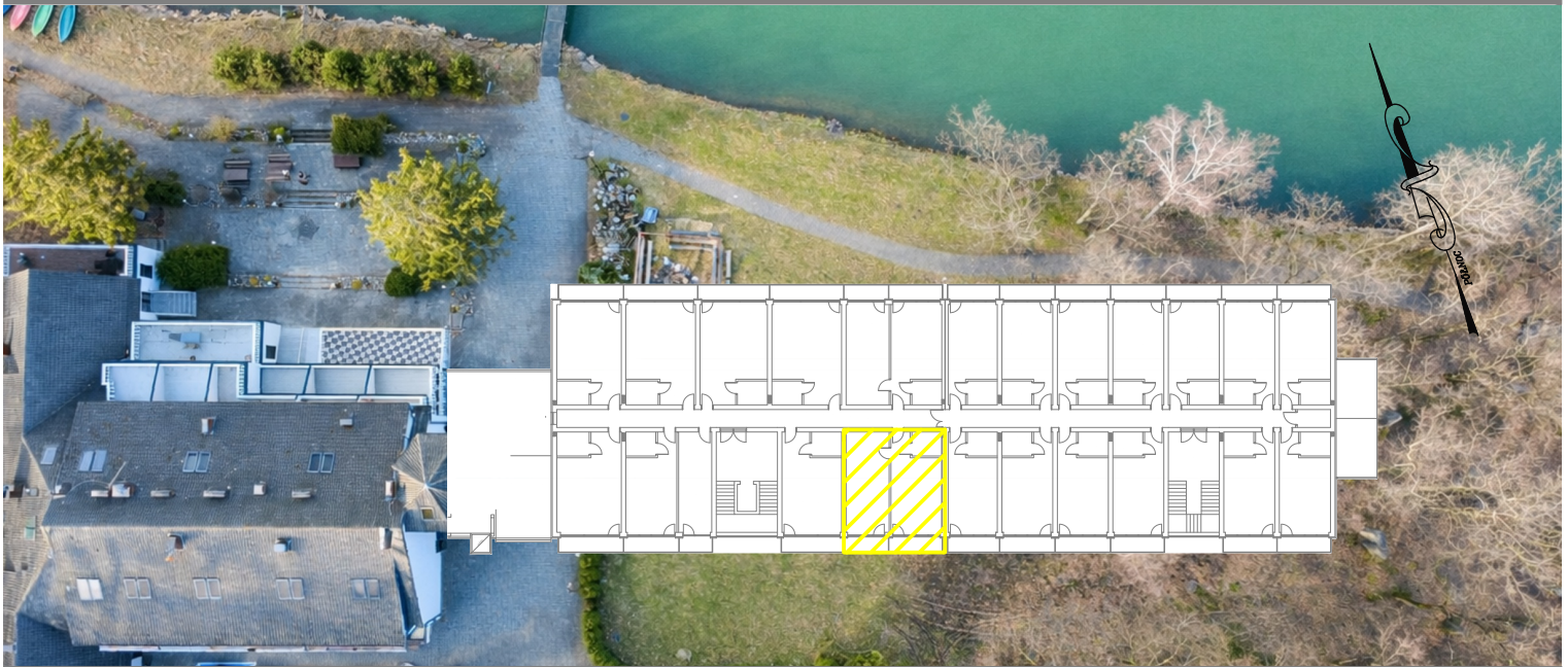
BUDYNEK HOTELU- I PIĘTRO