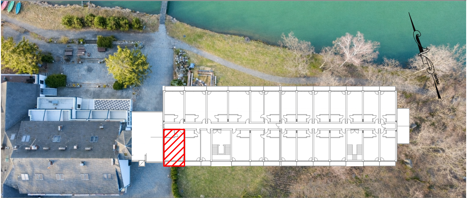
BUDYNEK HOTELU- I PIĘTRO