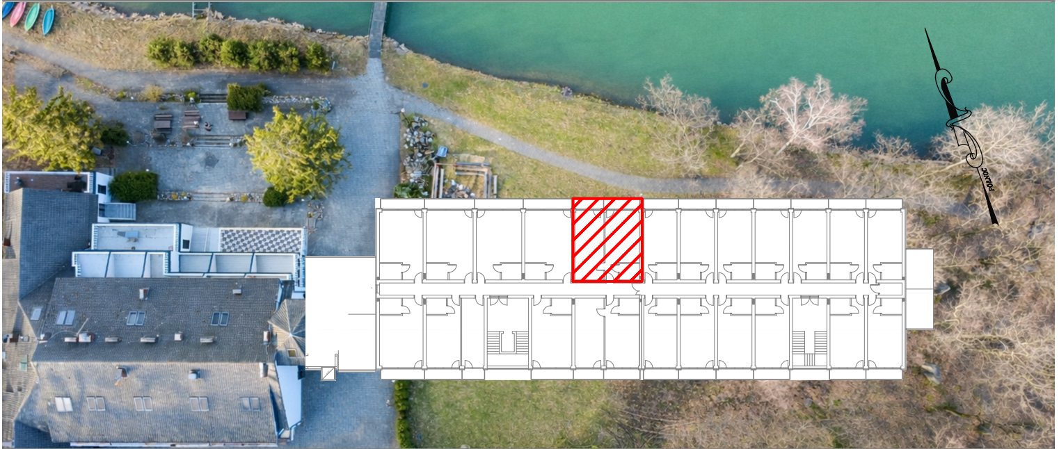
BUDYNEK HOTELU- I PIĘTRO