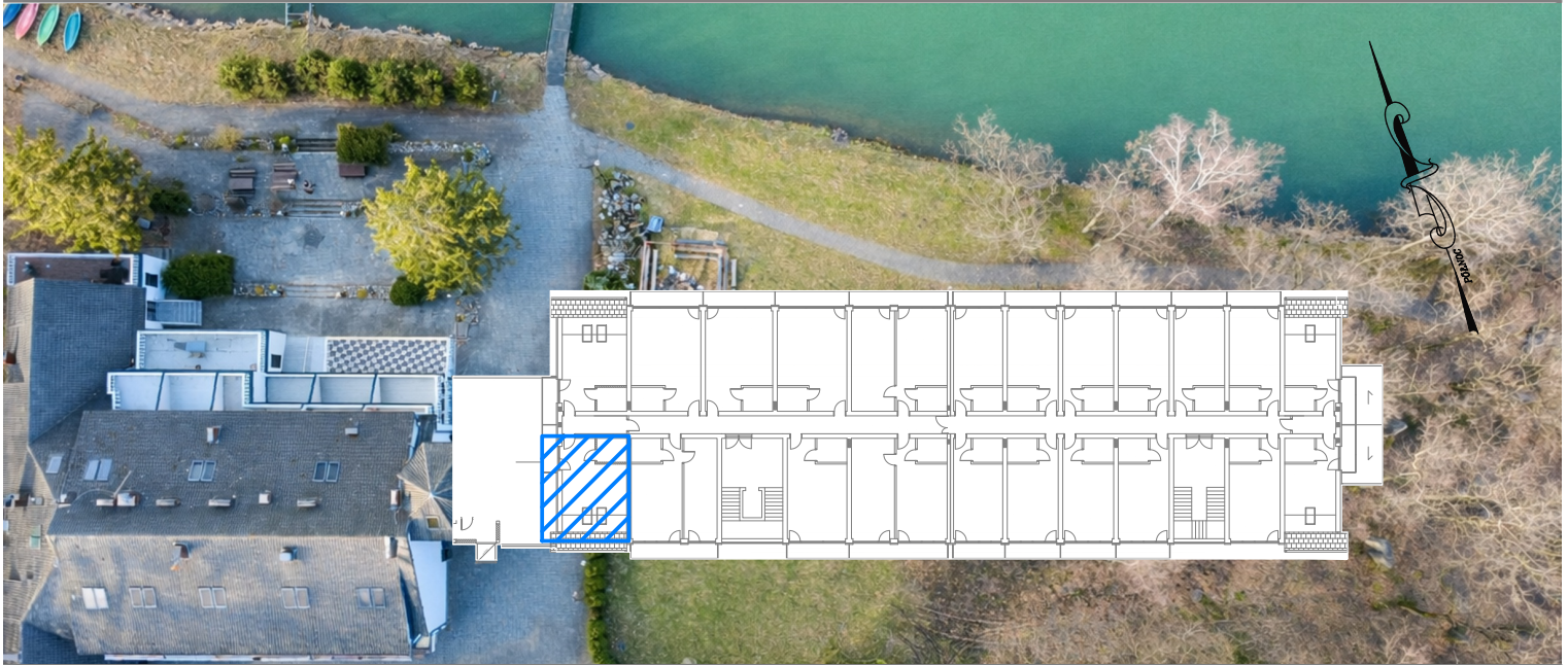
BUDYNEK HOTELU- II PIĘTRO